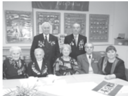
Герои-танкоградцы после встречи с молодежью

В этом году музей Монтажного комплекса ЮУрГТК отмечает знаменательную дату – 35 лет со дня своего основания. В связи с этим важным событием нам бы хотелось немного рассказать о музее, его истории, материалах, которые хранятся в его архивах.