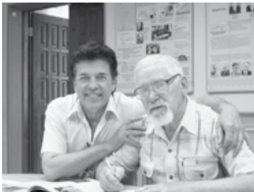
В 2016 г. музей посетил народный артист Беларуси, выпускник ЮУрГТК, В. Петров

Также музей является почти домом для юных студчорокцев, авторов уникальных статей в газету «Пресс-Колледж». Здесь мы планируем, обсуждаем очередной выпуск газеты, а иногда творческие планерки проходят в обрамлении чаепития.