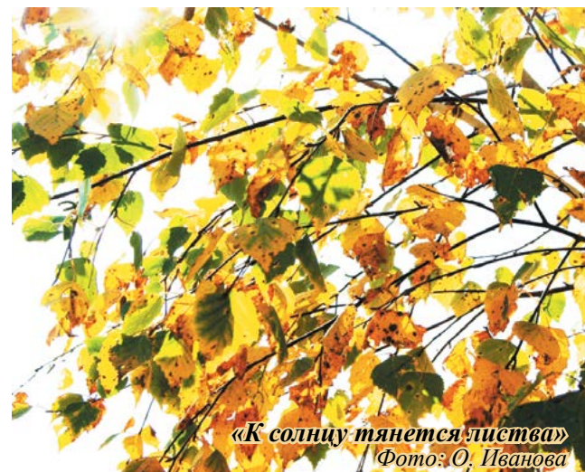
«К солнцу тянется листва»