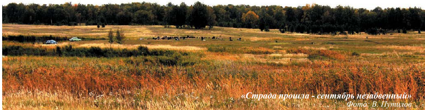
«Страда прошла - сентябрь незабвенный»