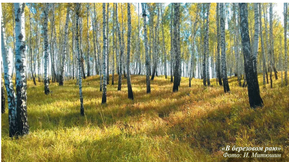
«В березовом рая»