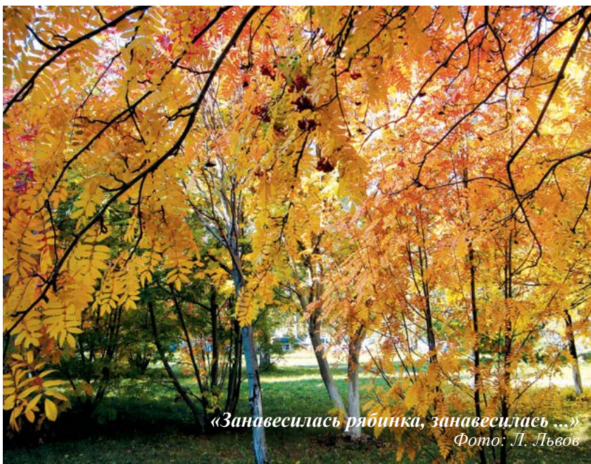
«Занавесилась рябинка, занавесилась ...»