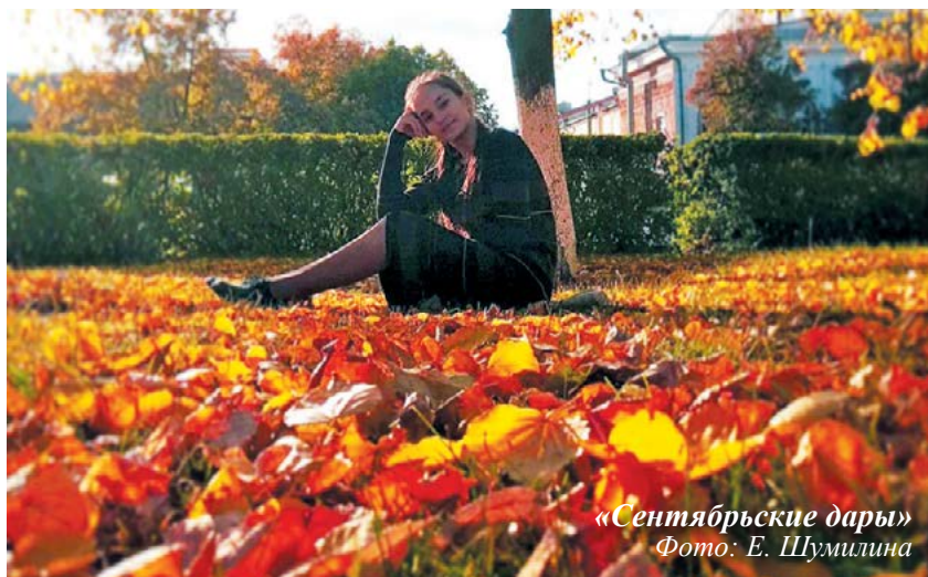
«Сентябрьские дары»