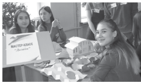
На снимке: мастер-класс по дизайну от студентов-архитекторов