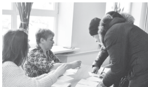
На снимке: идет активное голосование за благоустройство района