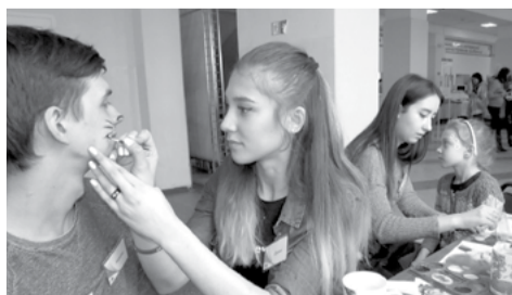
На снимке: аквагим – это модно!