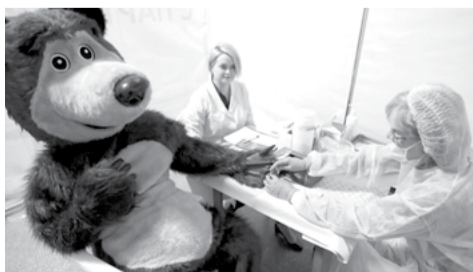
На снимке: и Мишка воспользовался услугой