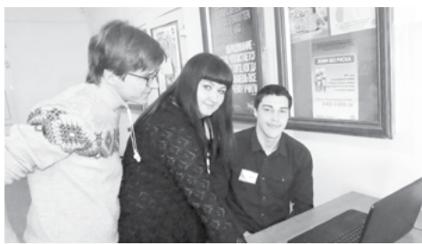
На снимке: момент профориентационного тестирования с психологом