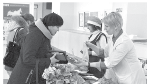
На снимке: в буфете много вкусностей