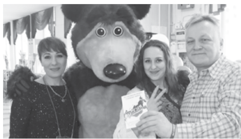
На снимке: настроение на участке – отличное!