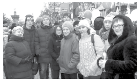
На снимке: участники митинга в честь присоединения Крыма к России