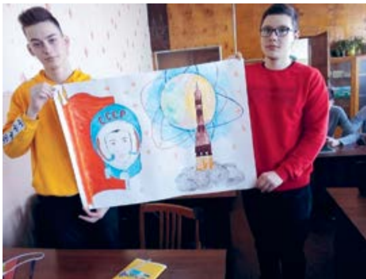
На снимке: студенты гр. ТМ-2976 демонстрируют плакат, посвященный космонавтике

Интересное мероприятие состоялось и в группе АР-1156. Это дискуссия на тему «Как снизить подростковую преступность?». В группе действовал «дискуссионный клуб». Тема, вынесенная на обсуждение, была посвящена проблеме подростковой преступности. Участники клуба работали с данными Портала