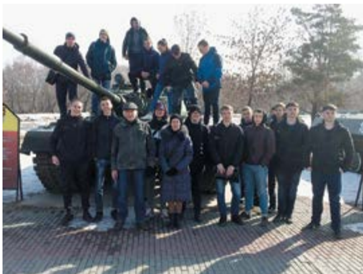
На снимке: студенты гр. АП-1126 и МП-1136 на экскурсии в Саду Победы