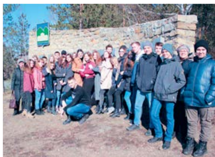
На снимке: студенты ЮУрГТК совершают путешествие

Чтобы познакомиться с окрестностями Кыштыма, мы доехали до посёлка Слюдорудник. Путь к нему проходит мимо таких известных достопримечательностей Южного Урала, как Сугомакская пещера и гора Сугомак. В XIX веке в этих местах работали золотые прииски,