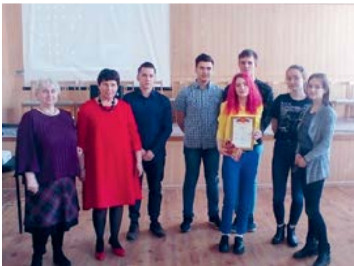
На снимке: участники и организаторы конкурса знатоков