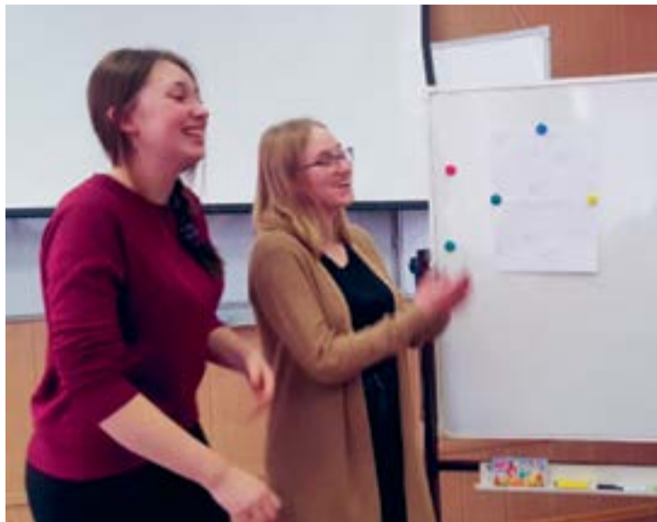
На снимке: студенты группы АР-1156 участвуют в дискуссии