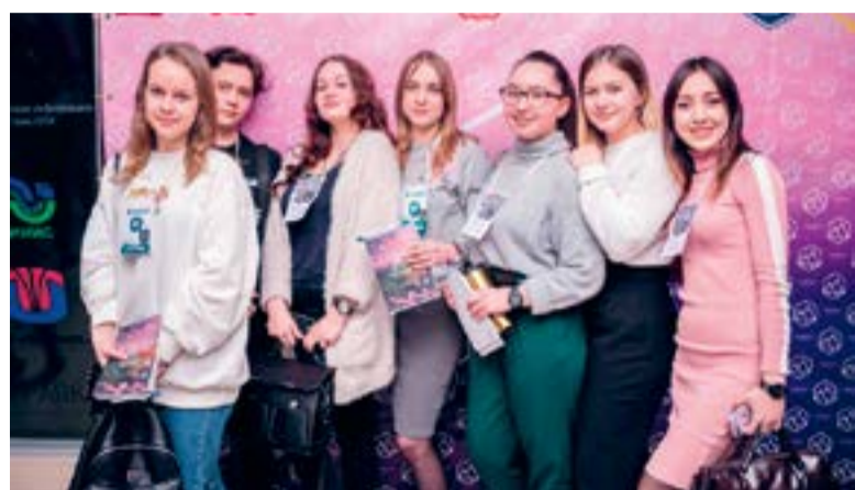
На снимке: студенты ЮУрГТК вместе с преподавателем стали участниками Дня тренингов

А. Исафилова, гр. ЗИ-126/б