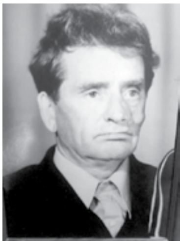
Вам, ветераны, в близи и дали, Низкий поклон мой до самой земли! Г. Кучер

22 июня 1941 года наша страна вступила в Великую Отечественную войну. Из-за холода, голода,