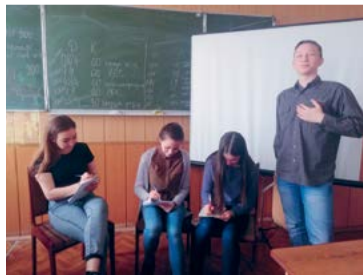
На снимке: студенты группы ВВ-1296 - весело проходит квест