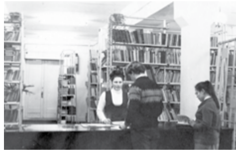
Библиотека МНК в восьмидесятые годы прошлого столетия

В 2010 году, в результате слияния Монтажного колледжа, Машиностроительного и Политехнического техникумов, появился Южно-Уральский государственный технический колледж. Сегодня в колледже работают библиотеки в каждом комплексе, их четыре.