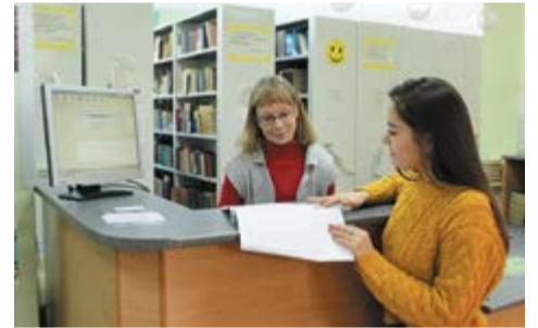
Библиотека МНК сегодня