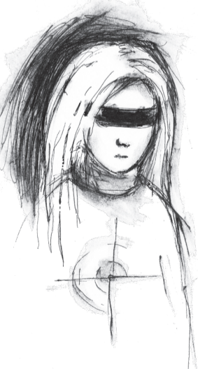
Графика Натальи Трофимовой

Шагая по жизни с улыбкой Мы слезы других часто льем. И страх, называя ошибкой, Мы в страхе, сгорая, живем.