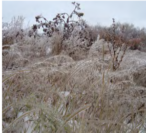
Где найдешь такую растительность? Каждая былинка в хрустале! В этом гололеде исключительность: Украшать нам будни на земле