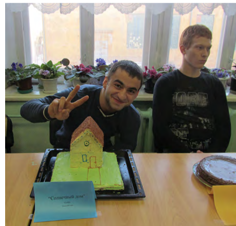
На снимке: вкусные торты-своими руками