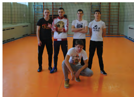
На снимке: волейболисты ЮУрГУТК