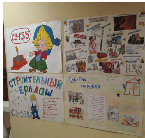
На снимке: Творчество студентов