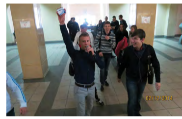
На снимке: акция в колледже

В этом году по всему городу идет борьба с курением. И это радует, что наша страна отдает предпочтение здоровому образу жизни. 2 декабря, в 12 часов, в холле главного корпуса Южно-Уральского государственного технического колледжа студенты Совета самоуправления Электромонтажного отделения провели акцию по борьбе с курением «Сигареты – на конфеты».