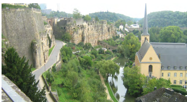
На снимке: виды Люксембурга

Герцогство Люксембург – независимое суверенное государство, во главе которого стоит герцог, наследник королевской фамилии Нассау. Столица страны, носящая то же название, основана на месте древней крепости. Люксембург не похож ни на один европейский город, так как в самом центре, окружённый старинными крепостными стенами и башнями, раскинулся прекрасный парк, который является историческим центром города, любимым местом отдыха и проведения досуга местных жителей и приезжих. «Мы хотим остаться теми, кто мы есть» – таков девиз жителей Люксембурга. На улицах можно слышать