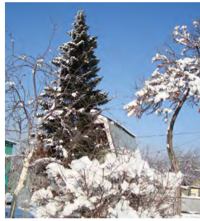
Выпал первый снег В саду так тихо – Нету места шуткам, озорству... Жимолость и пихта с облепихой Примеряют платья к Рождеству