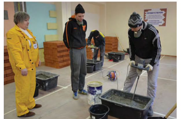
На снимке: готовится раствор для кладки кирпича

А.В. Бокарева, мастер производственного обучения