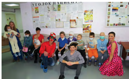
На снимке: встреча добрых друзей

В этот раз нас ждал сюрприз, потому что именно в этот день в онкологический центр приехал 31 канал снимать репортаж и наши волонтеры во время игровой программы попали под объектив телевизионной камеры. Уже в вечернем выпуске можно было увидеть студентов нашего колледжа в репортаже под названием «Спектакль в больничном коридоре». Но для нас, волонтеров, засветиться на телевидении не главное, для нас главное, чтобы дети всегда были нам рады и весело улыбались при встрече. Мы очень хотим, чтоб они выздоровели и обрели полноценную жизнь. В свою очередь, мы бу-