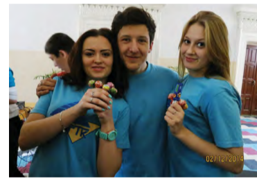
Есть замена сигаретам!