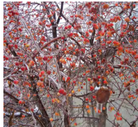
Не успела осень от зимы укрыться... Долго будет фруктам морозильник снится