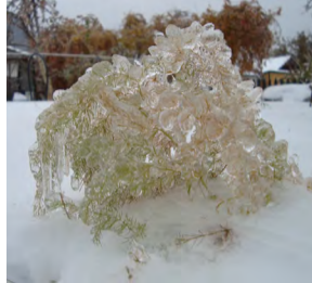
Трава сухая льдом покрылась – И вмиг в принцессу превратилась...

У многих челябинцев остался в памяти ноябрьский ледяной дождь, который совершенно неожиданно пролился с небес. Странные причуды природы тогда вызвали большой переполох – с большим трудом люди добирались на работу – гололедица на дорогах вызвала настоящий транспортный коллапс. А вот фотохудожнику Л. В. Львову удалось в эти дни сделать настоящие уникальные снимки. Давайте полюбуемся оригинальными фотографиями, право, они того стоят... Стихотворные строки принадлежат автору фотографий.