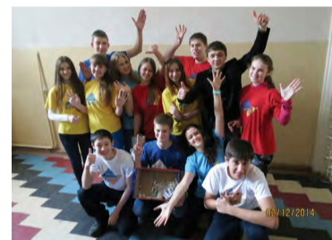
На снимке: студенты за здоровый образ жизни

К. Латина, гр. СК-256/6