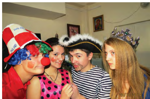
На снимке: студенты ЮУрГТК в Онкологическом центре

дем продолжать их радовать, дарить улыбку, поднимать настроение и жизненную силу настолько это возможно.