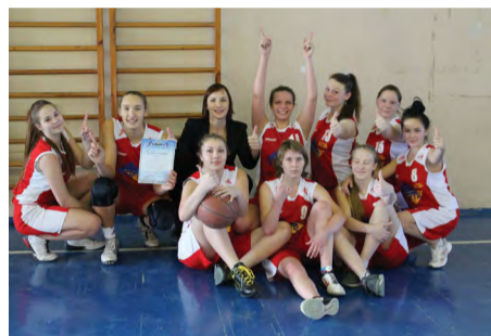
На снимке: команда девушек-баскетболисток