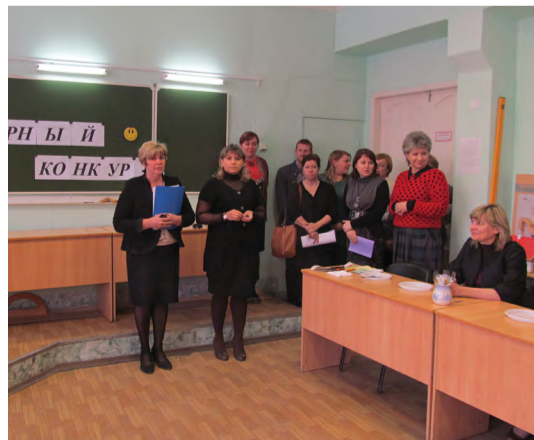
На симке: Начало кулинарного конкурса