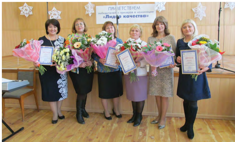
На снимке: победители и призеры конкурса

В этом году торжественная церемония награждения проходила на территории второго комплекса, в небольшом актовом зале. Желающих попасть на праздник было так много, что в зале не хватало свободных мест и пришлось доставлять дополнительные стулья из столовой. Но это так, мелочи, которые совершенно не повлияли на атмосферу самого события.