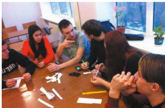
На фото: участники викторины