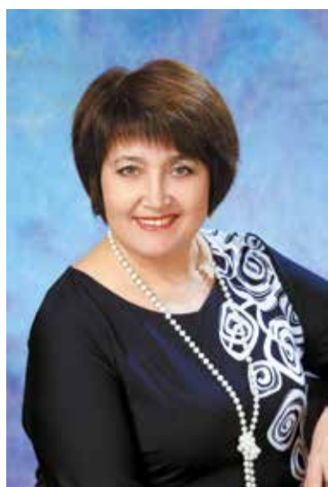
Она мудрый наставник!