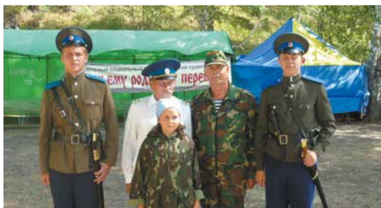
На фото: летние полевые сборы Злата пчелка

Если патриотизм – это олицетворение любви к Отечеству, сопричастность с его историей, составляющая духовно-нравственной основы личности, гражданская позиция и потребность в достойном, самоотверженном служении Родине, то военно-патриотическое воспитание призвано готовить подрастающее поколение к достойному служению Отечеству, умению защищать интересы страны. И это многокомпонентное образование, соответствующее всей системе требований общества и его Вооруженных Сил.