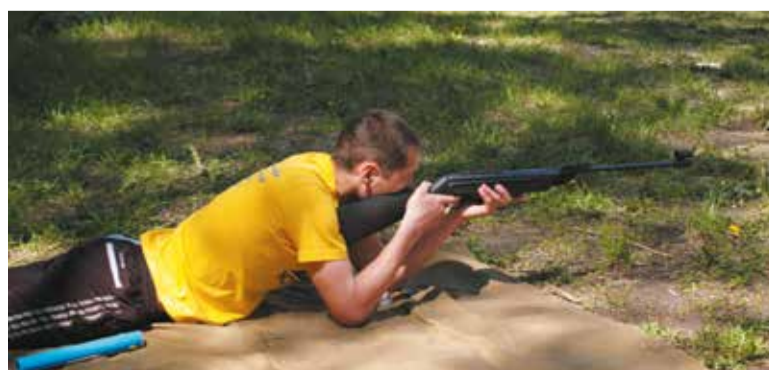
На фото: общеколледжская военно-спортивная эстафета

Вместе с тем её содержание нацелено на реализацию задач такой важнейшей составной части формирования патриотической работы со студентами, как военно-патриотическое воспитание. Члены клуба не только занимаются спортом и военной подготовкой, но и активно участвуют в торжественных мероприятиях, посвященных памятным датам в истории России. Например, к очередной годовщине вывода войск из Афганистана в клубе прошла встреча с ветеранами-афганцами. 22 февраля члены клуба будут проводить праздник «Сегодня допризывник – завтра воин», посвященный Дню защитника Отечества.