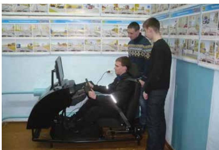
На снимке: тренажер рабочего места водителя

Министерства образования и науки Челябинской области для использования на занятиях по техническому обслуживанию и ремонту автомобилей было приобретено современное диагностическое и сервисное оборудование. Сегодня все готово для создания в ПТК полностью хозрасчетного подразделения, призванного на реальных объектах автомобильного транспорта производить практическое обучение студентов. Таким образом, мы рассчитываем, что ребята будут приобретать необходимый опыт работы под