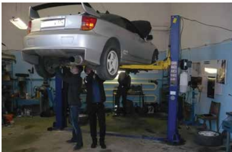
На снимке: студенты ТО на практике в лаборатории ремонта автомобилей

Практика по специальности и рабочей профессии проводится в учебно-производственных мастерских, а также на предприятиях и в фирмах города. Среди социальных партнеров колледжа, охотно принимающих студентов на практику, ООО «УралСпецМонтаж», ООО «Челябинск - LADA» – официальный дилер LADA в Челябинске, ООО «Легион Моторс Сервис» и другие компании по обслуживанию автомобильного транспорта.