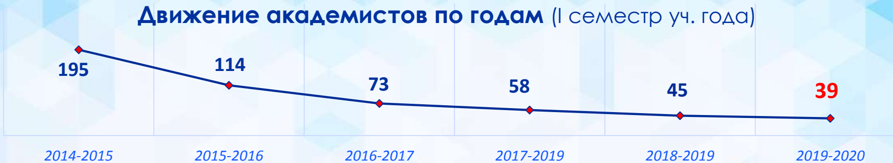
Движение академистов по годам (I семестр уч. года)

Количество предоставленных академических отпусков продолжает снижаться – это хорошая тенденция. В 2014-2015 уч. году под видом академических отпусков решалась проблема академических задолженностей.