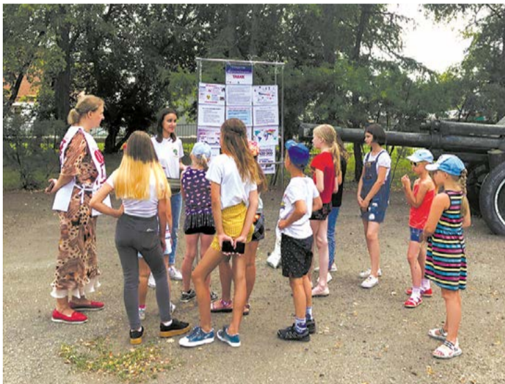
Приобщение к ЗОЖ в с. Миасское