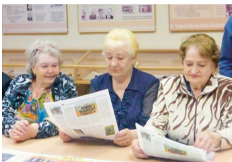
Ветераны колледжа в музее