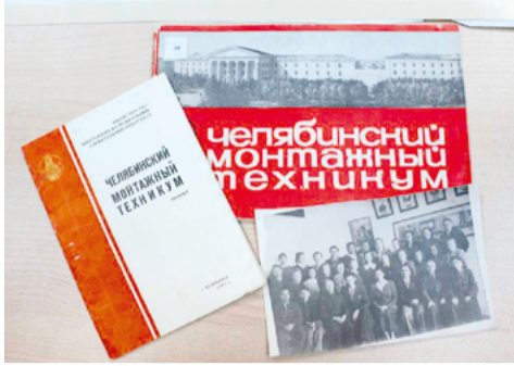
Архивные документы не подвластны времени