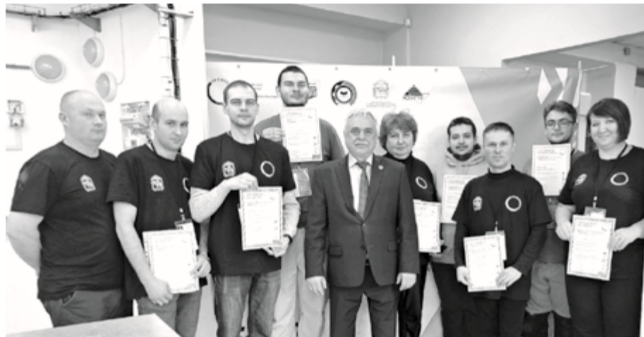
Начало на стр. 1