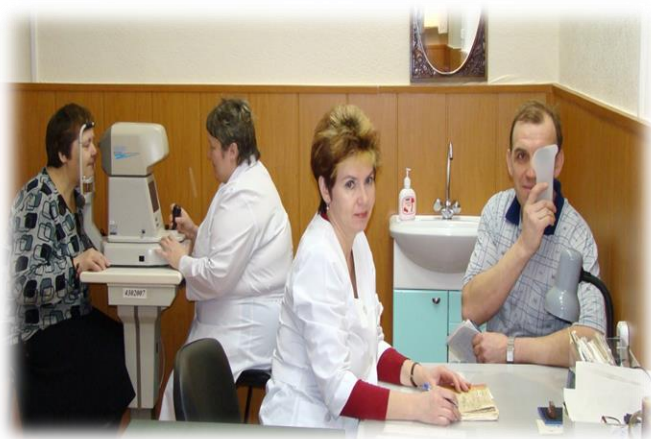
Ежедневный прием врачей