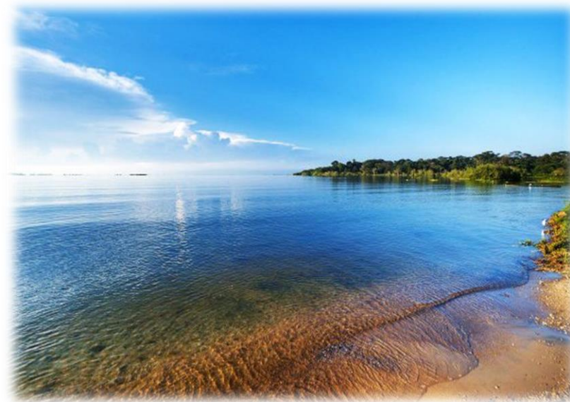
ОК Рябинка - Крым