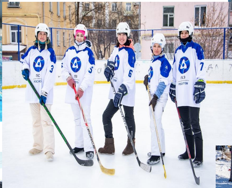
Хоккей на валенках