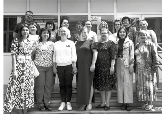
Июнь 2025 г.