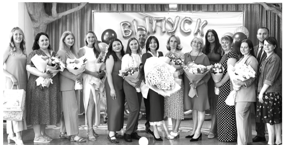
Коллектив ОЭИ на вручении дипломов выпуску 2025 г.