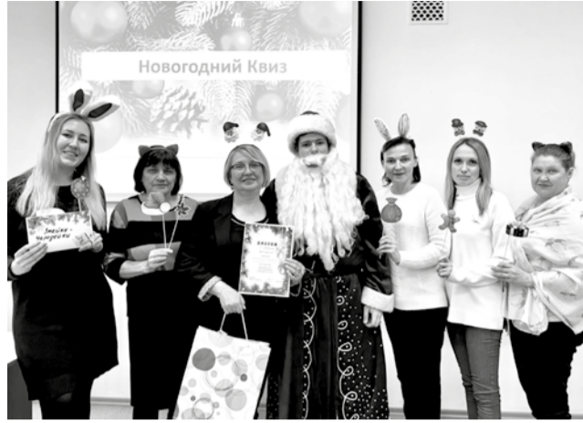
Змейки-чародейки – победили новогоднего квиза