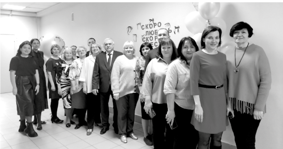
7 марта 2025 г.