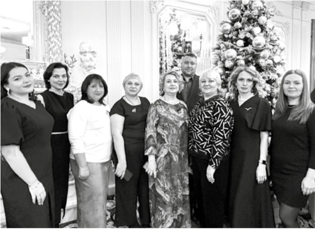
Декабрь 2024, новогодний корпоратив